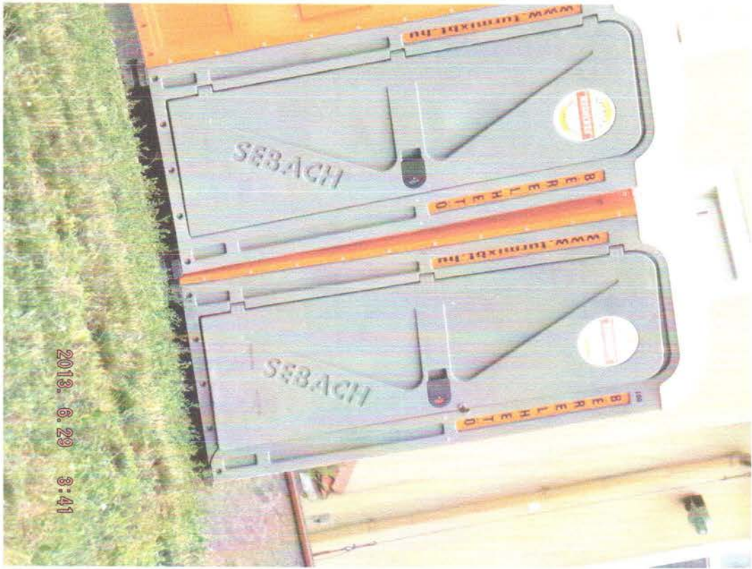
2 darab mobil WC