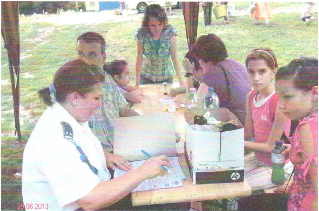
Prevenció- Balmazújvárosi Rendőrkapitányság