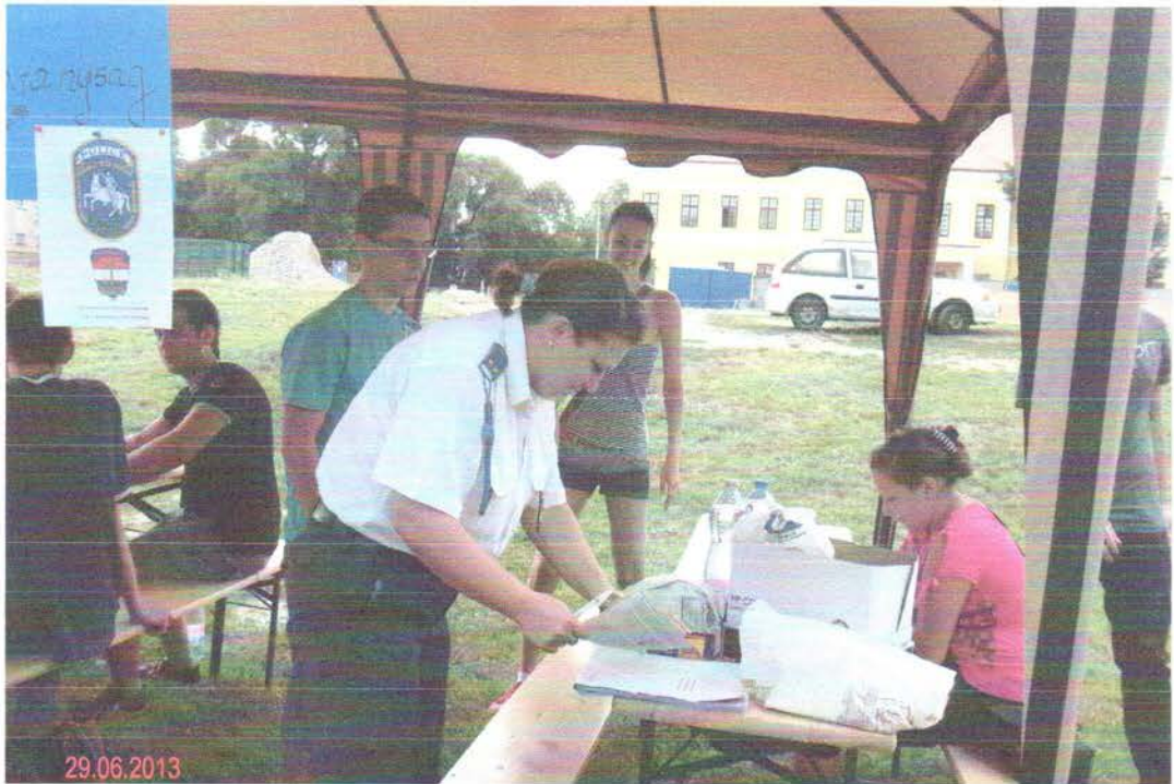
Prevenció- Balmazújvárosi Rendőrkapitányság