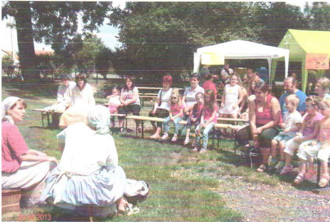
Kuckó művésztanya előadása