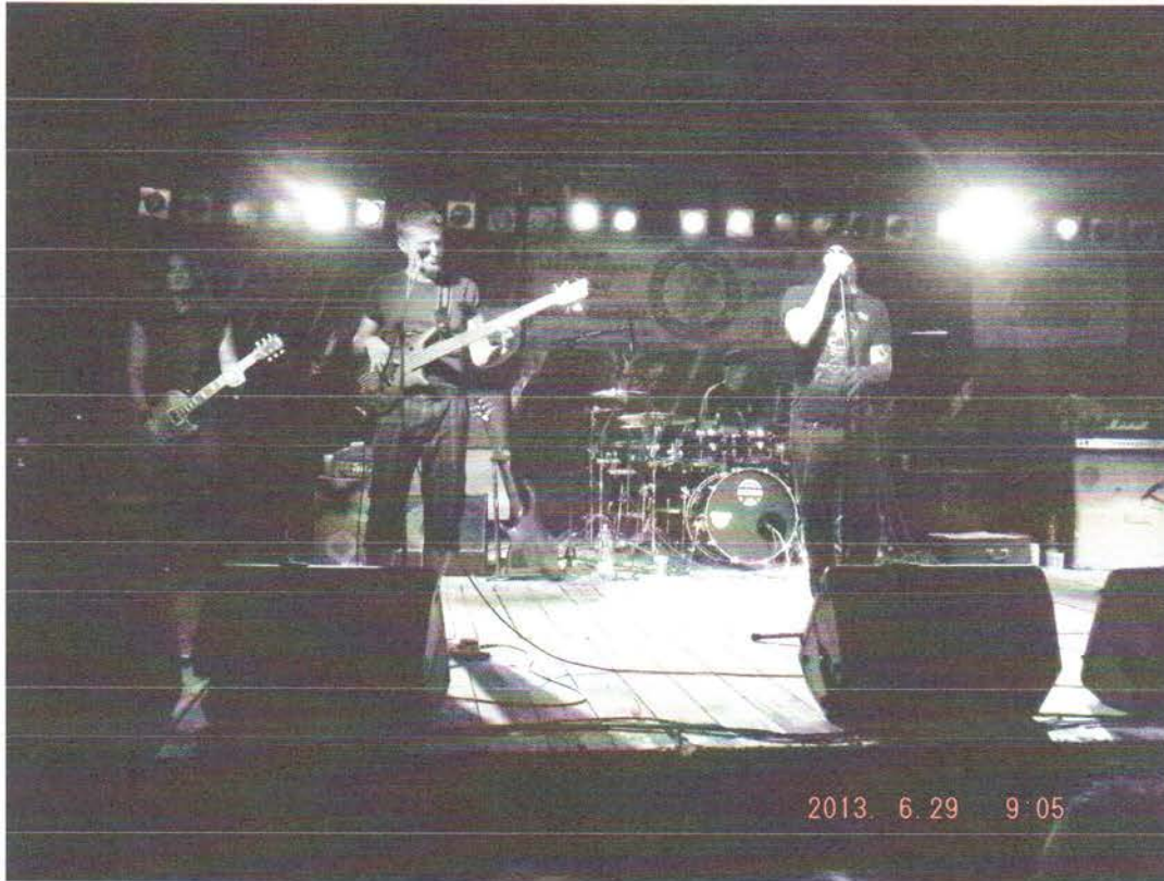
Black Out koncert