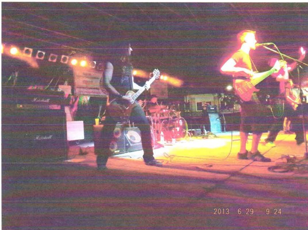
Black Out koncert