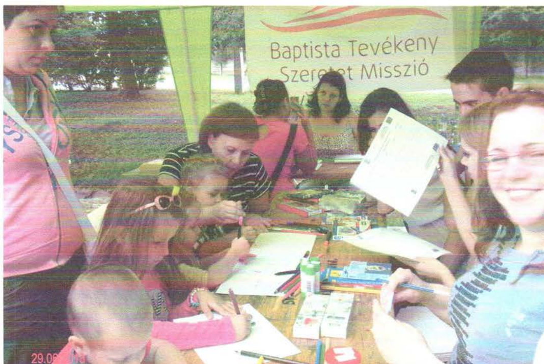
Prevenció – Baptista Tevékeny Szeretet Misszió Szenvedélybetegek Balmazújvárosi Nappali Intézménye