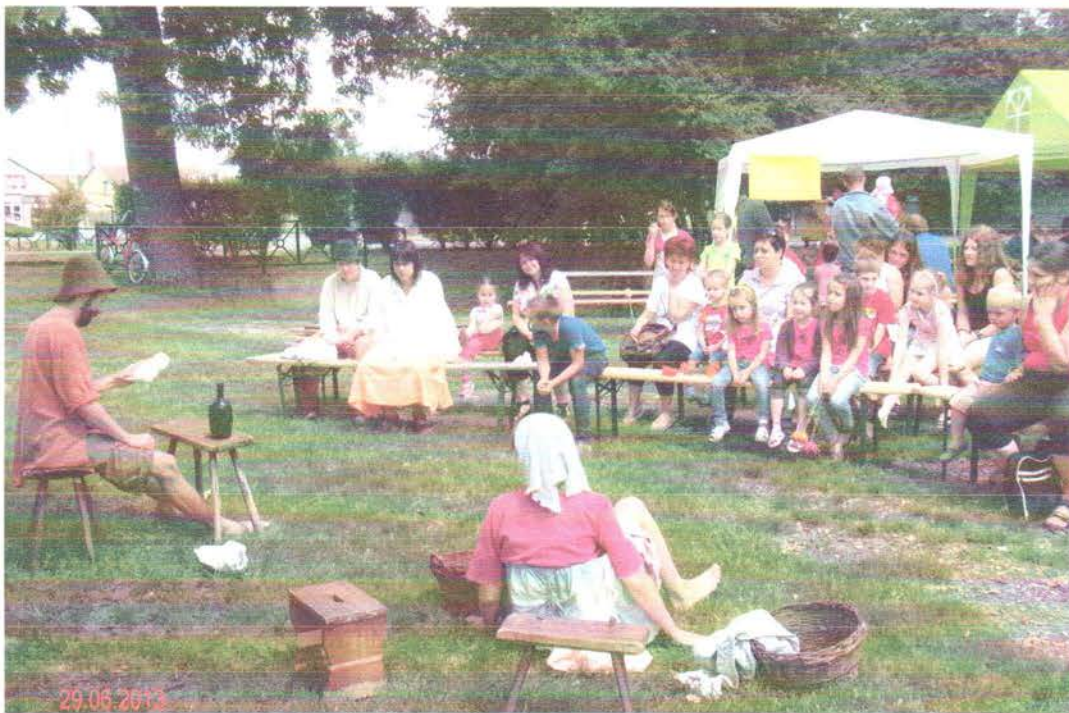
Kuckó művésztanya előadása