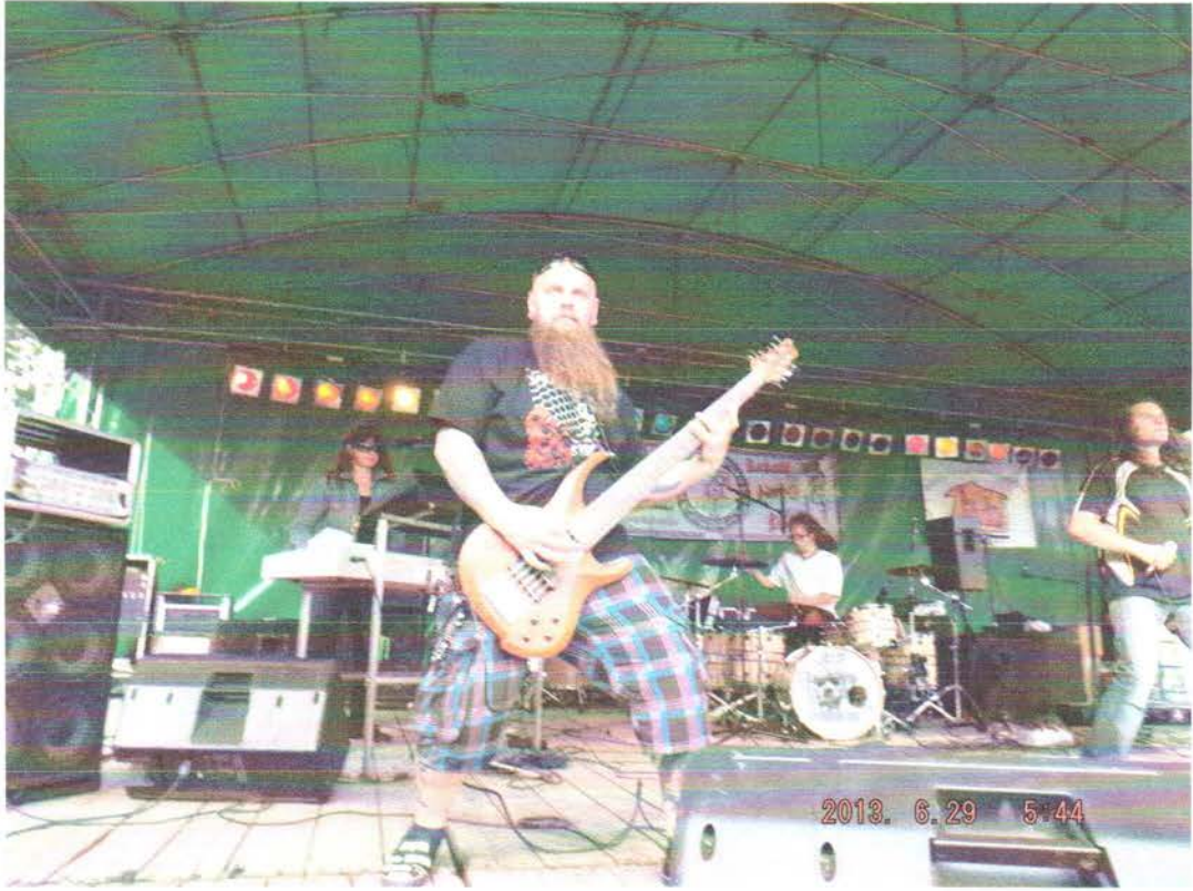
Chrome Rt koncert